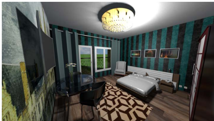
Рисунок 2 – Моделювання номеру butik-готелю у графічному редакторі «Sweet home-3D»

Для моделювання будівлі засобу розміщення розроблено перелік приміщень певного функціонального призначення (приймально-вестибюльна група, житлова, культурно-дозвілева, фізкультурно-оздоровча та інші), розраховані їх площі. Загальна площа приміщень склала 6 450 м 2 . Прийнято 5 поверхів, площа готелю в основі – 1 290 м 2 . Приклад елементів моделювання номеру наведено на рис. 2.