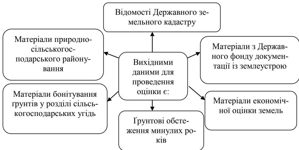
Рис. 2. Інформаційна база нормативної грошової оцінки земель

Оцінюючи землю як предмет праці, слід враховувати її атрибути, які впливають на вигоду обробітку (площа, конфігурація, бар'єри тощо), що впливають на віддачу від обробітку, а також додаткові інвестиції в підвищення родючості землі, що дозволить більш точно визначити земельний дохід. Оцінка землі як просторова основа повинна брати до уваги наявність інфраструктури та логістичних факторів, таких як віддаленість від центрів продажу та якість доріг, що впливає на вартість і, таким чином, дохід від землі. Розташування землі відносно широкого товарного ринку впливає на швидкість і потенційні продажі, а отже, і на доходи від землі. Забезпечення земельних ділянок соціальними закладами чи іншою інфраструктурою впливає на пропозицію молодих кваліфікованих кадрів у цій місцевості, що впливає на продуктивність праці, а отже й на доходи від землі.