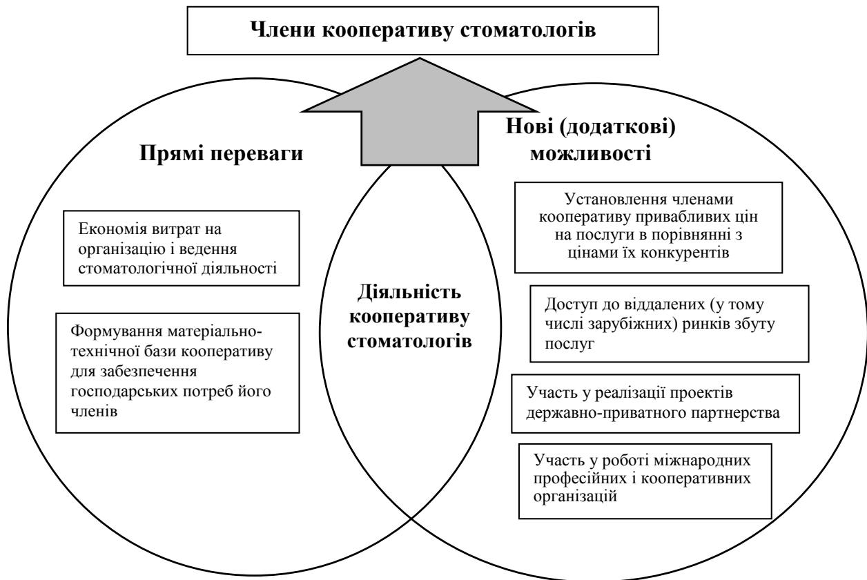
Рис. 3. Прямі переваги та нові можливості членів кооперативу від його діяльності

ву, що можуть бути отримані від прямих взаємовідносин з іншими суб'єктами ринку, слід згадати й цілу низку нових можливостей, що відкриває перед членами їхня участь у кооперативі стоматологів (рис. 3).