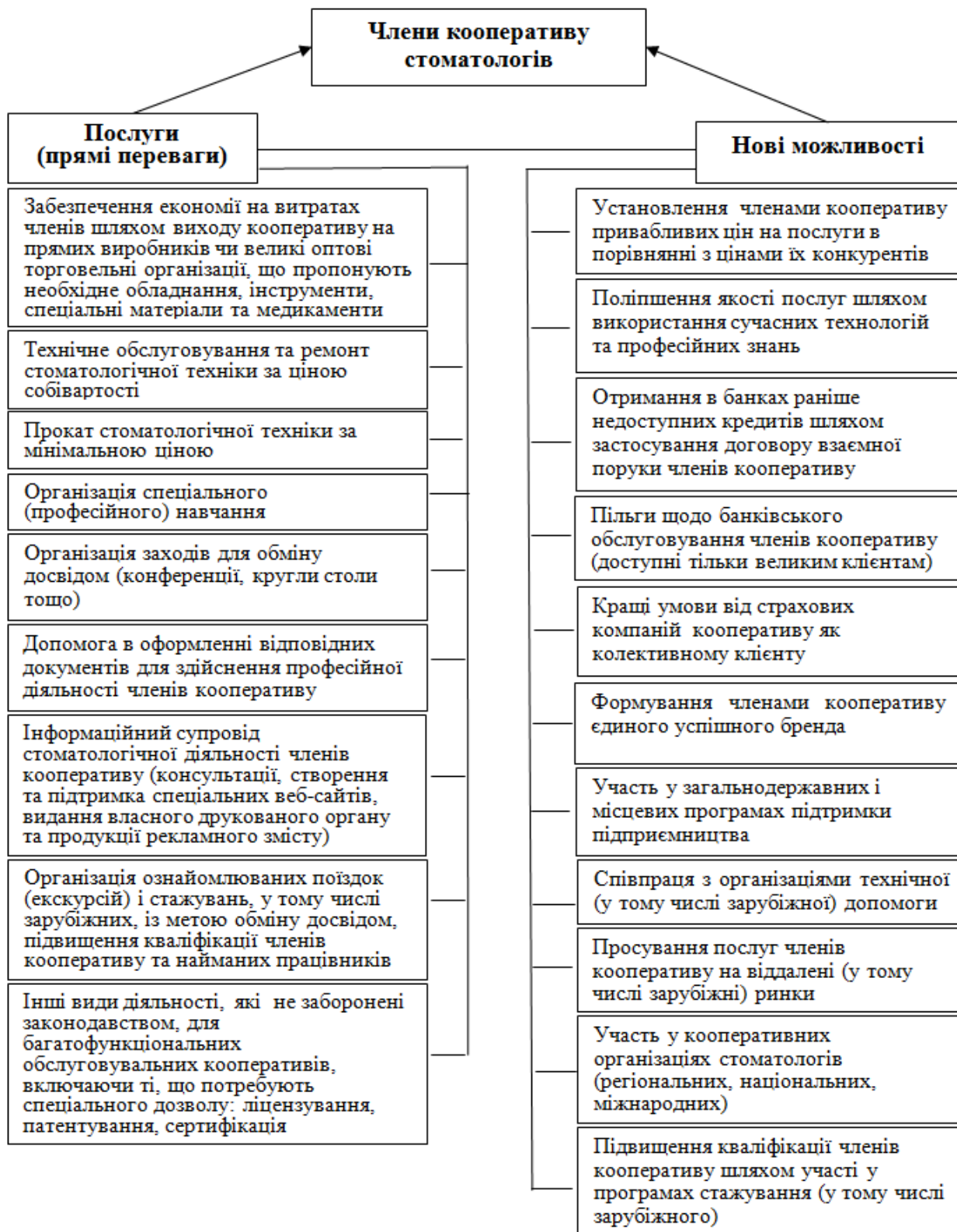
Рис. 4. Перелік послуг для членів кооперативу стоматологів та нових можливостей від його діяльності