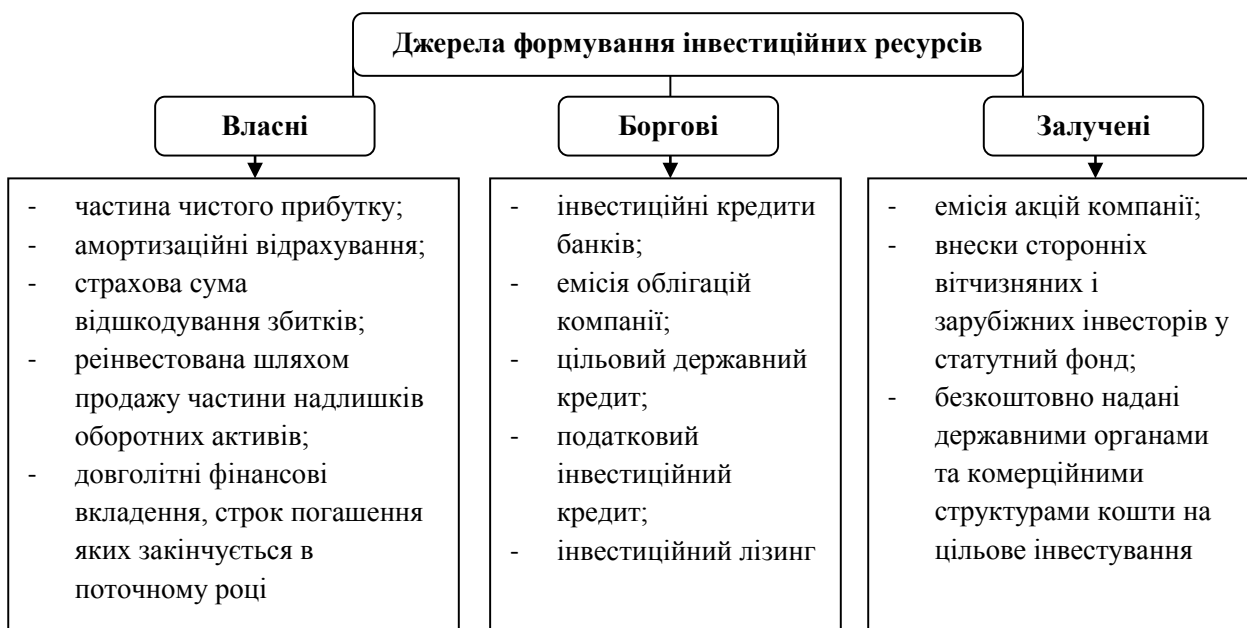
Рис. 2. Джерела формування інвестиційних ресурсів [11, с. 91]

не забезпечення. Як вище було зазначено, інстиції можуть виступати у вигляді грошових коштів, цінних паперів, майна тощо. Джерела формування інвестицій представлені на рис. 2.