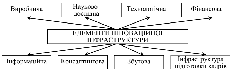
Рисунок 1.1 – Склад інноваційної інфраструктури за основними елементами [84] або