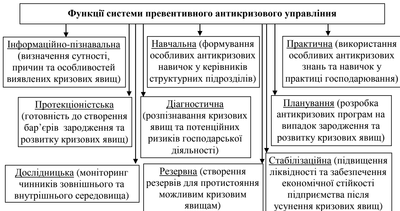
Рис. 1. Функції системи превентивного антикризового управління

Визначені завдання системи превентивного антикризового управління, мають забезпечуватися через виконання наступних функцій, рис. 1.