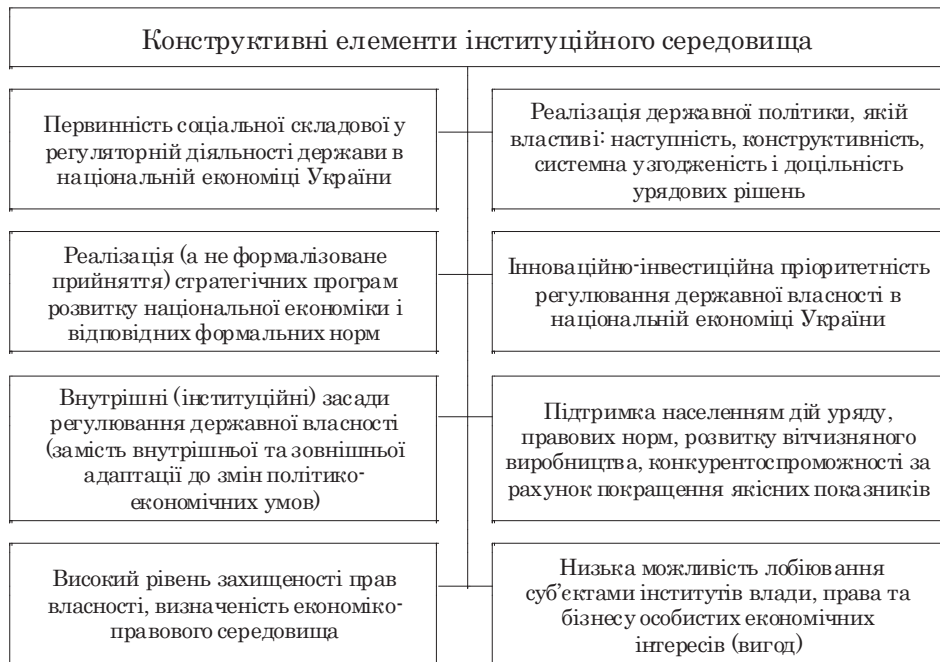
Рис. 2. Формування елементів інституційного середовища завдяки реалізації ІМРДВ, авторська розробка

елементи інституційного середовища, що забезпечує вирішення суперечностей функціонування національної економіки (рис. 2).