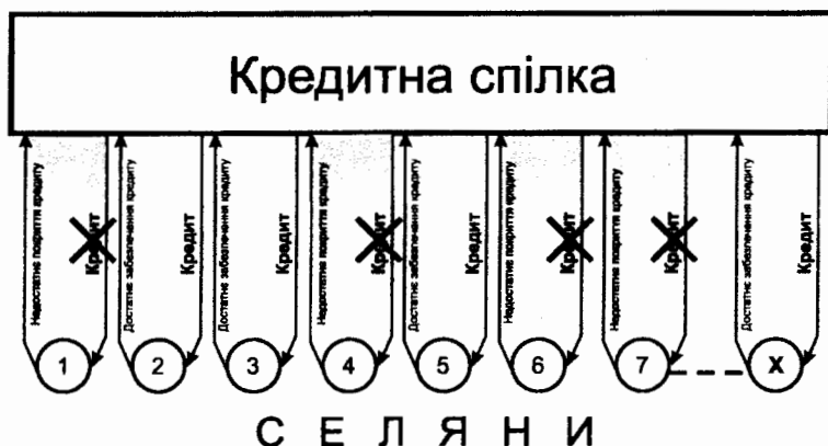
Рис. 7.1. Схема утворення позикового кола сільських господарів