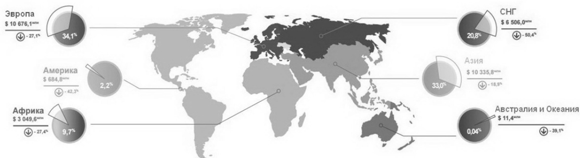
Рисунок 1 – Динамика экспорта украинских товаров [1]

По итогам 10 месяцев 2015 г. основными странами-партнерами, куда Украина экспортировала свои товары, были страны ЕС (33,4%), РФ (12,8%), Турция (7,2%), Китай (6,8%), Египет (5,4%) (рисунок 2).