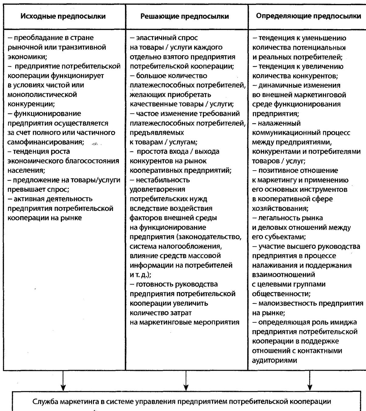
Рис. 1. Предпосылки функционирования службы маркетинга на предприятиях потребительской кооперации

Система управления маркетингом предприятий потребительской кооперации должна включать шесть подсистем управления, а именно: управление исследованием маркетинговой среды, управление разработкой маркетинговых стратегий, управление организацией маркетинга, управление маркетинговыми системами, управление маркетинговой эффективностью и управление маркетинговыми функциями. Это обеспечит комплексность управленческих решений, связанных с повышением эффективности функционирования данных предприятий.