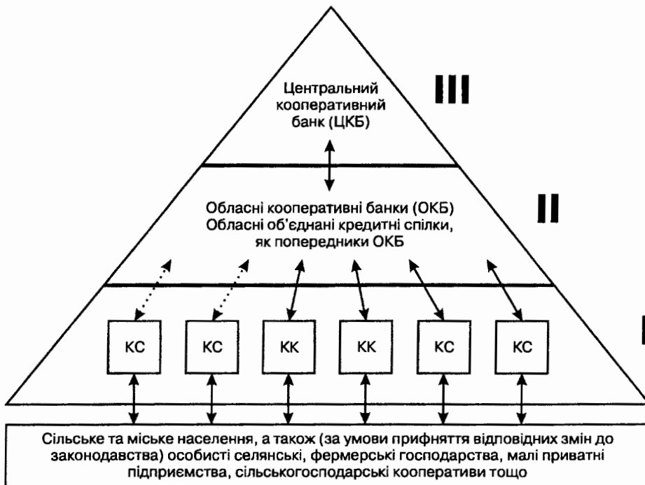
Рис. 2. Модель системи аграрних кооперативних банків України

Крім цього, важливим елементом формування повноцінної кооперативної банківської системи є створення системи гарантування вкладів, яка має захищати всю кооперативну кредитну систему від неплатоспроможності будь-якої кредитної спілки, кооперативу чи кооперативного банку у випадку неспроможності виконання ними зобов'язань перед клієнтами через несприятливі обставини. Гарантійний фонд має діяти як окрема структура з незалежним менеджментом. Він буде тією "парасолькою", яка на основі ідеї взаємного страхування захищатиме всіх учасників системи від несприятливих фінансових наслідків і завдяки цьому сприятиме підвищенню довіри до всієї ко-