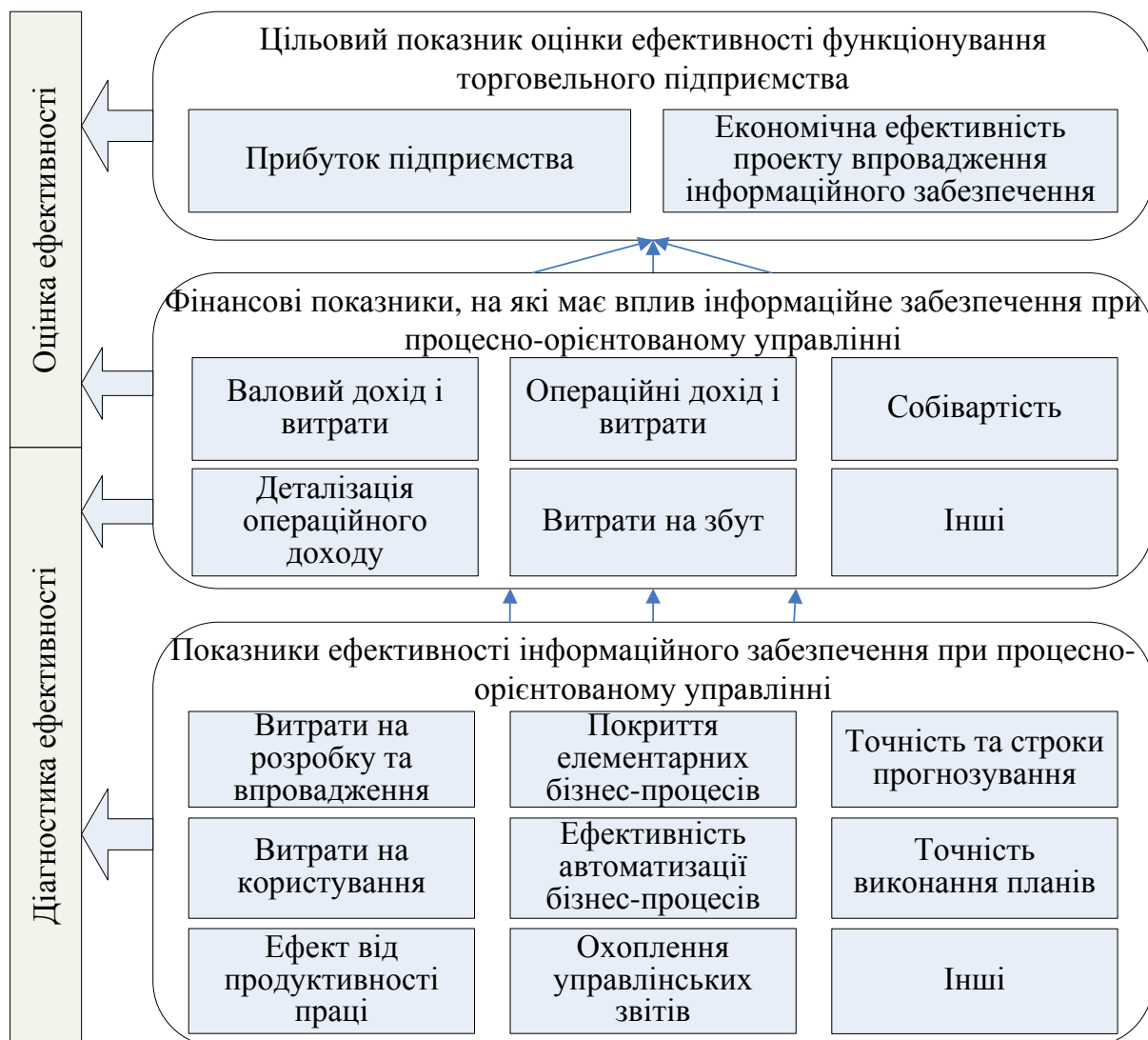
Рис. 2. Структура аналізу ефективності інформаційного забезпечення при процесно-орієнтованому управлінні торговельним підприємством

Обов'язковим етапом процесу розробки та впровадження інформаційного забезпечення при процесно-орієнтованому управлінні торговельним підприємством є діагностика його ефективності. Для діагностики ефективності інформаційного забезпечення при процесно-орієнтованому управлінні запропоновано використовувати відповідну модель, яка пов'язує цільові показники торговельного підприємства з показниками, що характеризують виконання задач, що призводять до досягання поставлених цілей. Структуру цих показників наведено на рис. 2.