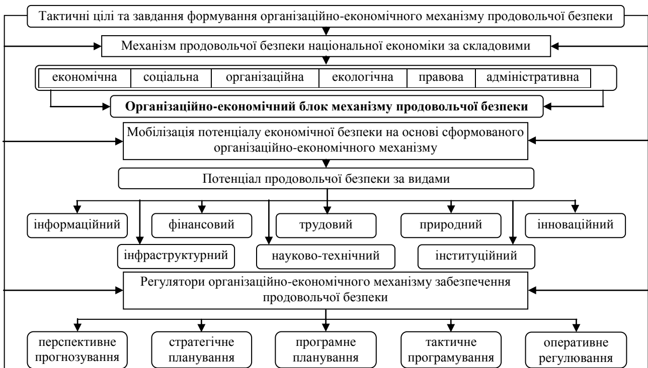
Рис. 2. Концептуальний підхід до формування організаційно-економічного механізму продовольчої безпеки соціально-економічної системи національного рівня

безпосередньо впливає на економіку країни, оскільки є фундаментом національної економічної безпеки загалом. Розроблено концептуальний підхід до визначення сутності організаційно-економічного механізму продовольчої безпеки соціально-економічної системи національного рівня, що враховує тактичні цілі, завдання досліджуваного механізму, визначає його складові та регуляторні функції держави у мобілізації потенціалу продовольчої безпеки (рис. 2). Доведено, що гарантією досягнення продовольчої безпеки України є стабільність внутрішнього виробництва. Це, в свою чергу, залежить від того, наскільки оптимальною з погляду самодостатності національної господарської системи є структурна збалансованість за галузями економіки. У їх складі вагому роль відіграє аграрний сектор.