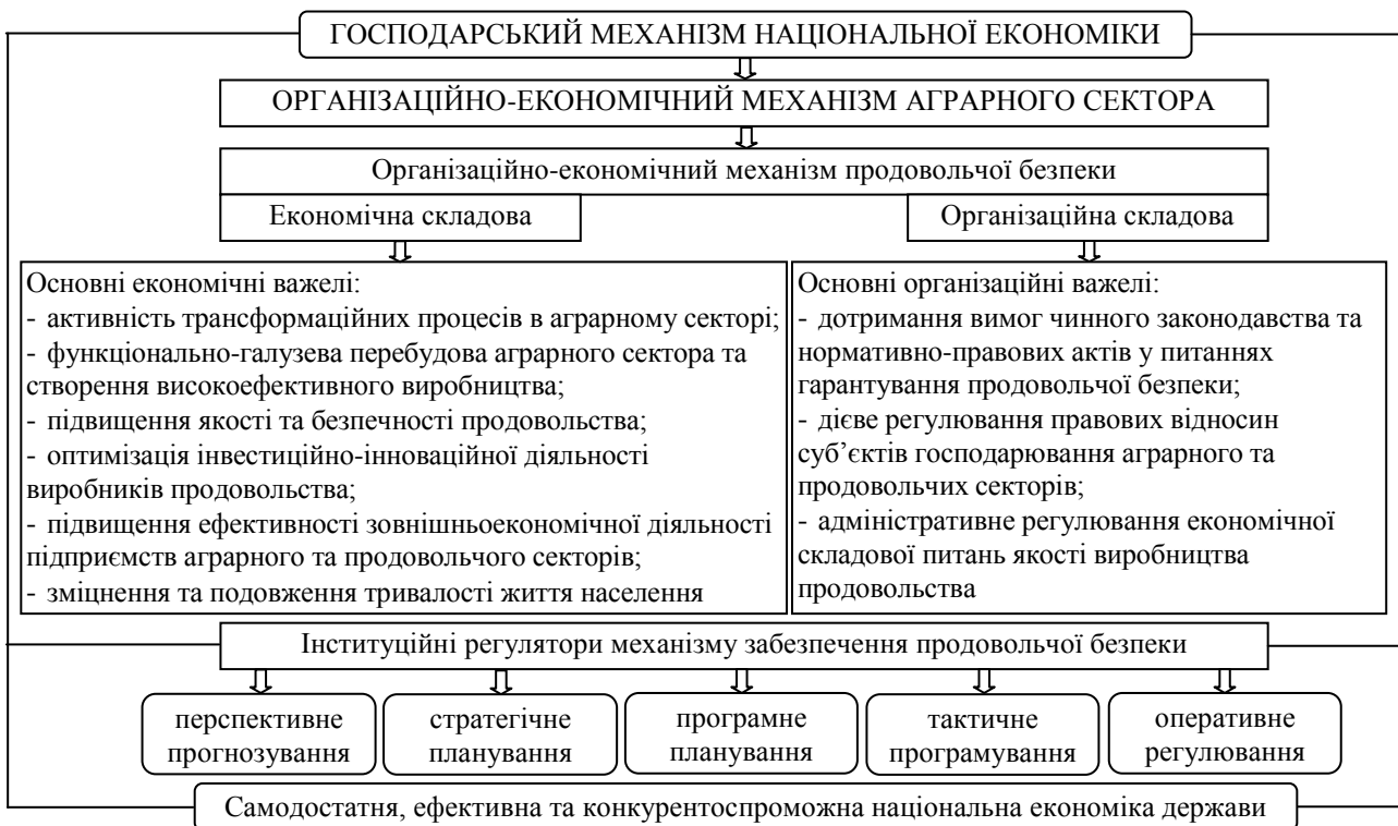
Рис. 1. Структурно-логічний підхід до організаційно-економічного механізму продовольчої безпеки макроекономічної системи

Визначено, що організаційно-економічний механізм продовольчої безпеки є складовою господарського механізму національної економіки, а отже, залежить від його ефективності. В наслідок розгляду теоретико-методичних підходів було з'ясовано, що організаційно-економічний механізм продовольчої безпеки визначається як складна цілісна система, яка включає економічні інструменти й методи та організаційні форми і принципи, що є частиною єдиного механізму, який підпорядкований правовим нормам та дає змогу державі забезпечити стабільність продовольчої безпеки країни. Розроблено структурно-логічний підхід до визначення сутності організаційно-економічного механізму продовольчої безпеки національного рівня, що враховує організаційні та економічні важелі механізму продовольчої безпеки та інституційні регулятори її забезпечення (рис. 1).