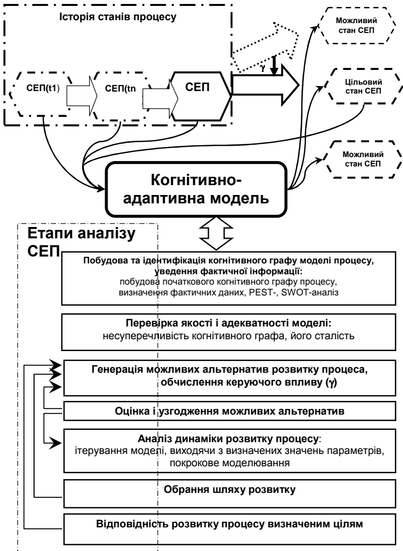
Рис. 2. Етапи аналізу соціально-економічного процесу (СЕП) із застосуванням КАМ