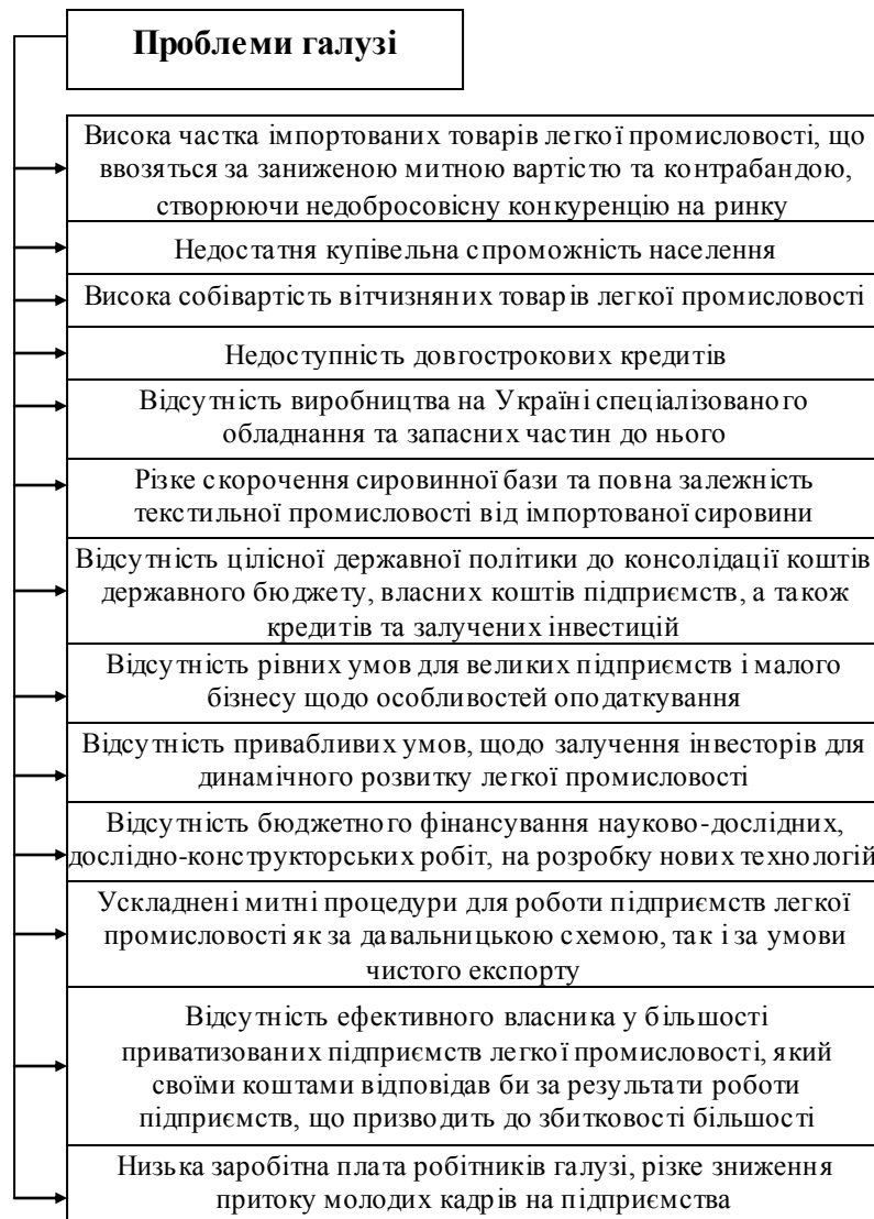
Рисунок 1. Проблеми галузі легкої промисловості України

Для вирішення зазначених проблем Міністерство промислової політики України розробило концепцію Державної цільової програми розвитку легкої промисловості на період до 2011 року, що визначає проблеми інвестиційно-інноваційного розвитку легкої промисловості, стратегію і основні шляхи їх розв'язання, а також принципи забезпечення комплексного розвитку легкої промисловості. Стратегія розвитку легкої промисловості повинна базуватися на використанні науково-технічного прогресу, застосуванні сучасних матеріалів, сировини і новітніх технологій, виготовленні продукції, яка відповідає міжнародним стандартам, технічному переоснащенні підприємств,