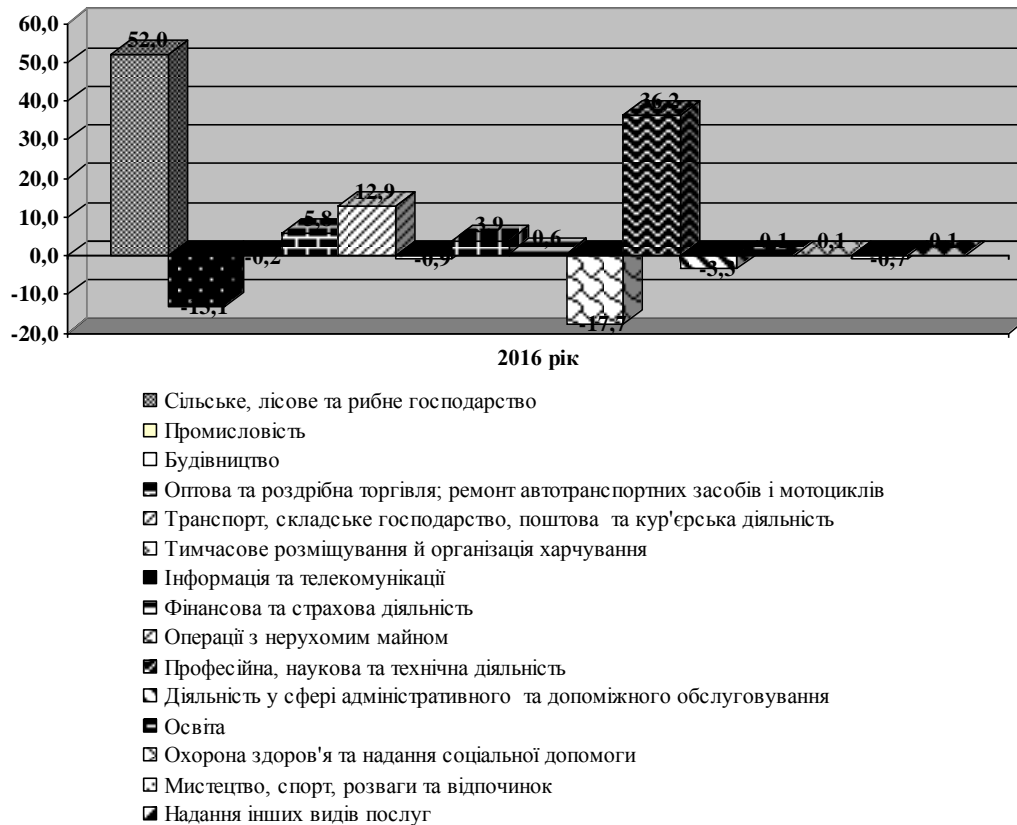
Рис. 2. Фінансові результати до оподаткування великих та середніх підприємств України за видами економічної діяльності за 2016 р.