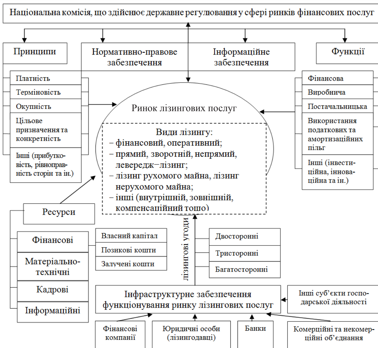
Рис. 3. Структура механізму функціонування ринку лізингових послуг

гових послуг відображає комплексну взаємодію інституційних, організаційних і методичних складових у формі лізингових принципів, функцій, процедур, видів і схем здійснення лізингових угод, що визначені на правовій основі, та їх практичне застосування для забезпечення розвитку суб'єктів підприємництва та національної економіки у цілому (рис. 3).