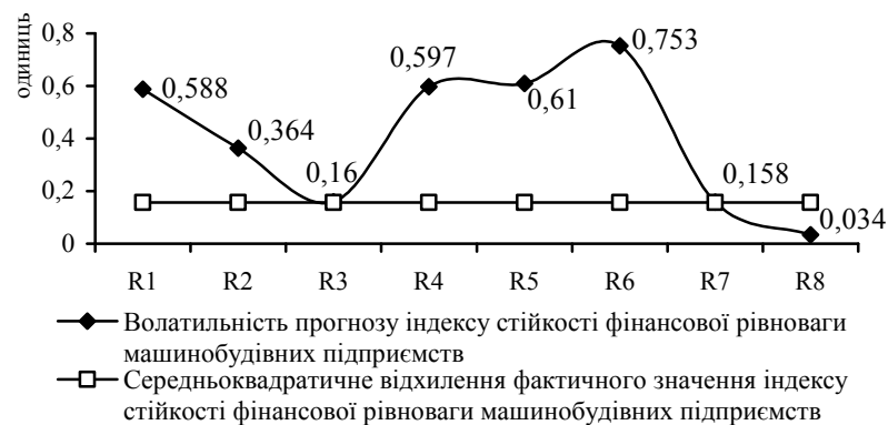
Рис. 1. Статистична характеристика варіантів моделювання індексу стійкості фінансової рівноваги машинобудівних підприємств України, розраховано автором

На основі фінансової звітності двадцяти шести підприємств машинобудівної промисловості України сформована вихідна база даних для прогнозування індексу стійкості фінансової рівноваги виробників цієї сфери [12]. Репрезентативність зробленої вибірки обумовлена часткою виробленої і реалізованої продукції цією групою підприємств, яка за 2017р. становить 24% у загальному обсязі промислової продукції машинобудування в Україні. Побудуємо економіко-математичну модель, що описує вплив зовнішніх факторів на стійкість фінансової рівноваги машинобудівних підприємств. Стандартна похибка кожного варіанту моделювання стійкої форми фінансової рівноваги вітчизняних машинобудівних підприємств наведена на рисунку 1.