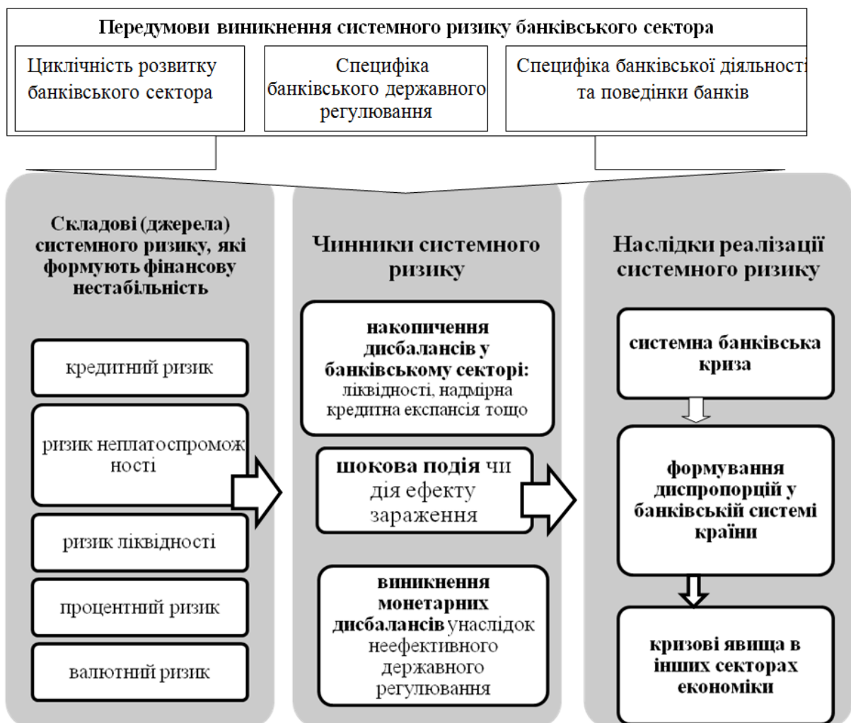
Рис. 2. Структурно-логічна схема оцінки передумов, джерел, чинників та наслідків реалізації системного ризику банківського сектору України

джерел, чинників та наслідків системного ризику банківського сектору засвідчує, що накопичення основних фінансових банківських ризиків (джерел виникнення системного ризику в банківському секторі, потенційно присутніх у банківській діяльності) може набувати системного характеру та призводити до формування фінансових дисбалансів (розглядаються як чинник системного ризику) і, як наслідок, до системних банківських криз, які виявляються у збитковості діяльності банківського сектору, масовому виведенні банків із ринку та їх націоналізації, неспроможності банків виконувати основні функції (зокрема кредитування економіки, ряд. 7 табл. 1).