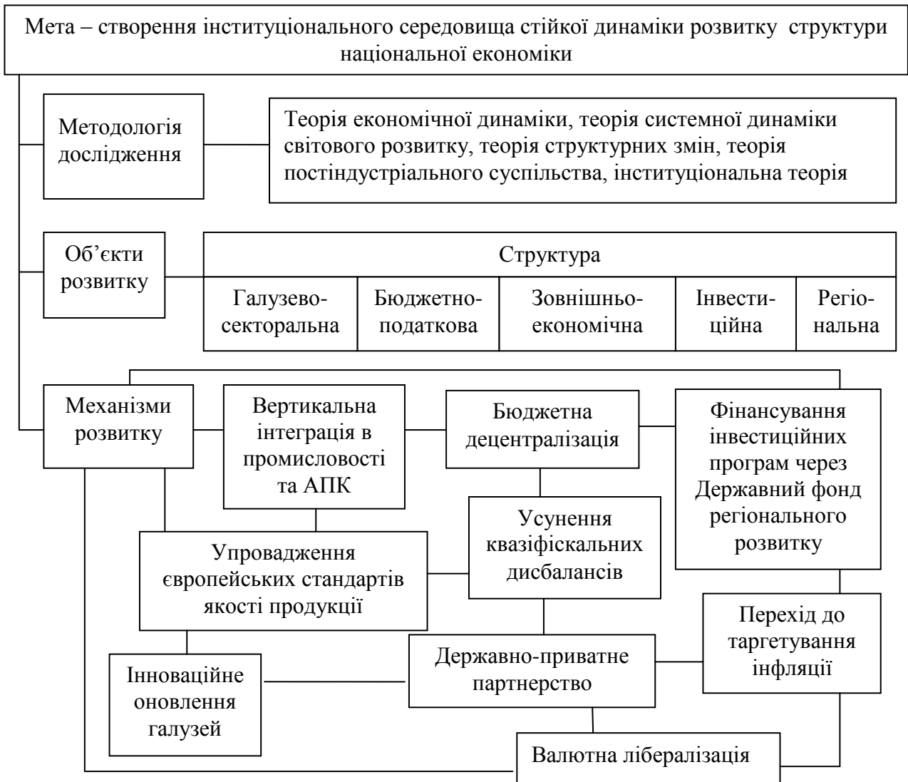
Рис. 1. Концептуальні засади вдосконалення структури національної економіки та механізмів її розвитку

Їх метою є створення інституціонального середовища стійкої динаміки розвитку структури національної економіки.