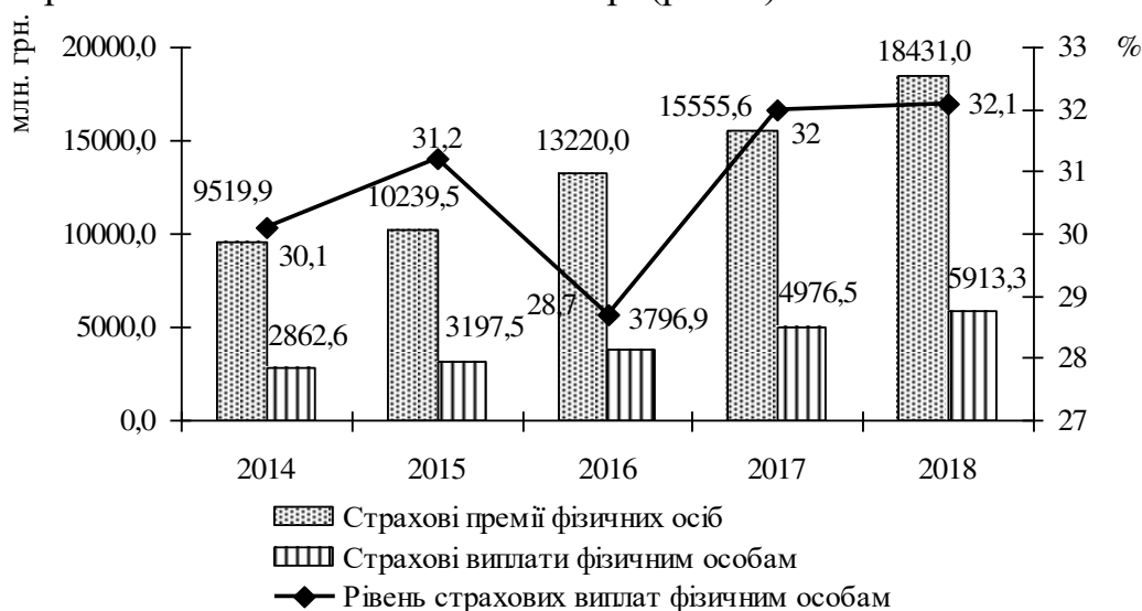
Рис. 1 Динаміка страхових платежів, виплат та рівня страхових виплат у секторі страхування фізичних осіб за 2014–2018 рр.

Рівень страхових виплат фізичним особам (відношення страхових виплат до страхових премій) станом на 31.12.2018 р. становив 32,1 %, що на 0,1 в.п. більше порівняно зі станом на 31.12.2017 р. (рис. 1).