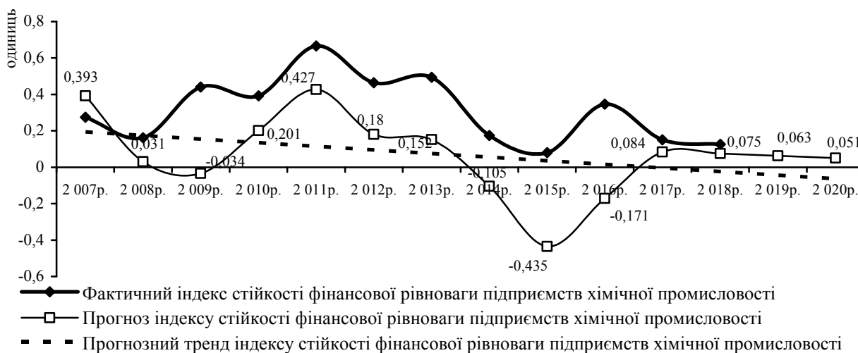
Рис. 3. Динаміка фактичного та прогнозного значення індексу стійкості фінансової рівноваги підприємств хімічної промисловості України до 2020р. [побудовано автором на основі моделі (1)]

Описаний вплив кожного зовнішнього фактора на стійкість фінансової рівноваги підприємства хімічної промисловості визнається справедливим на підставі дуже низької ймовірності нульової гіпотези (менше 0,02). Отже, економіко-математична модель (1) взаємозв'язку зовнішніх факторів та індексу стійкості фінансової рівноваги підприємств хімічної промисловості визнається придатною для практичного застосування (рис. 3).