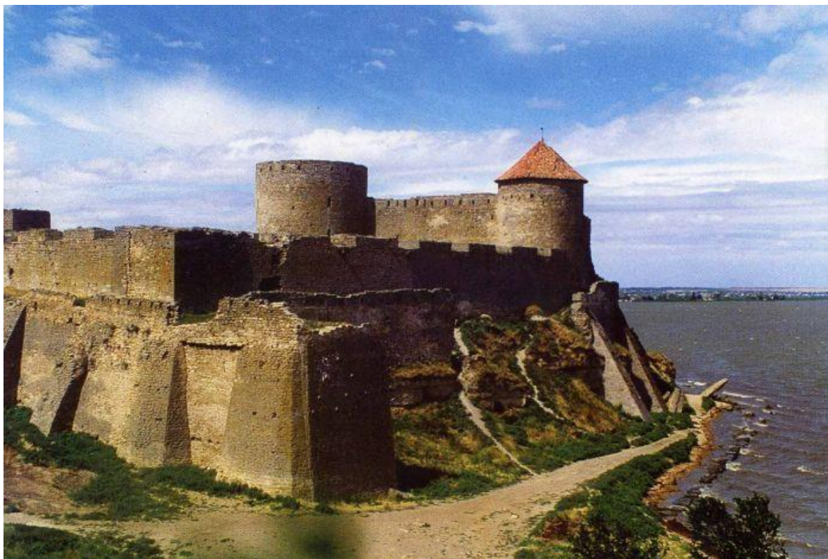
Фото. 1.3.1 Аккерманська фортеця, м. Білгород-Дністровський [4]

Однією з найбільш визначних і відомих пам'яток давнини Одеського регіону є Аккерманська фортеця в м. Білгород-Дністровському, побудована у ХV ст. (фото. 1.3.1).