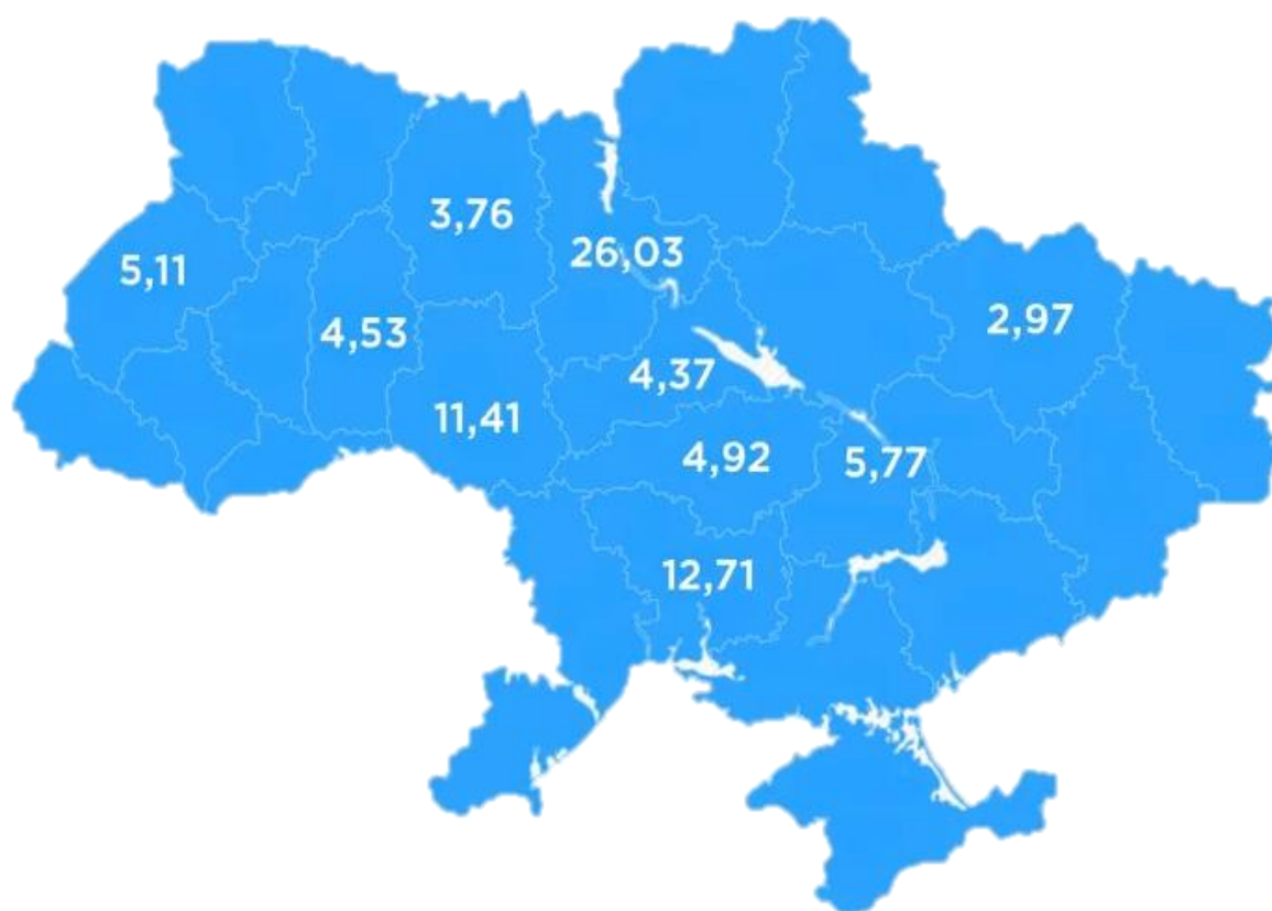
Рис. 2.1.1 Топ-10 областей України, із яких прямують до Одеси [25]

«Київстар» був з Київської, Миколаївської та Вінницької областей (сумарно – понад 40 % внутрішнього потоку) (рис.2.1.1), а серед представників зарубіжних напрямків, як і раніше, лідером є Росія. Загалом на закордон припало 21 % курортників (рис.2.1.2).