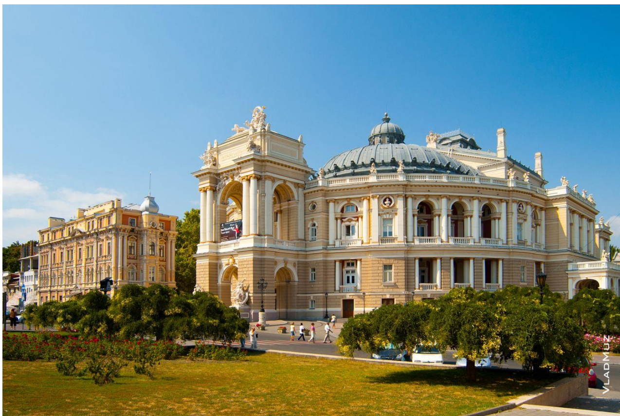
Фото. 1.3.5 Одеський театр опери та балету, м. Одеса [4]

Ще однією пам'яткою без якої не можна уявити туристичну Одесу звісно ж можна назвати Одеський театр опери та балету (фото 1.3.5).