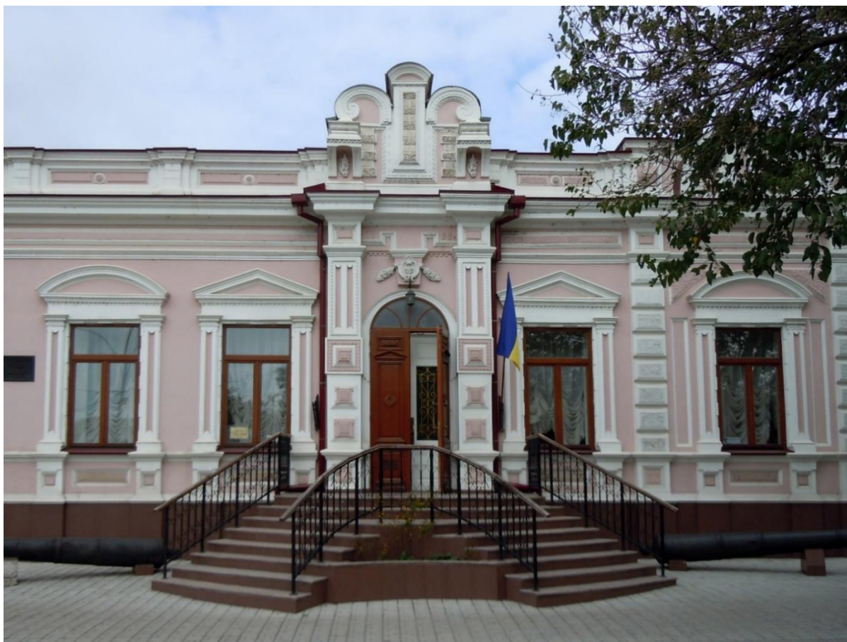
Фото 1.3.9 Ізмаїльський історичний музей О. В. Суворова, м. Ізмаїл Одеської обл. [4]

Про філію музею історико-краєзнавчого музею О. В. Суворова ми вже згадували а про сам музей ще не розповіли. Експозиція музею знайомить із життям та діяльністю полководця, його епохою (фото 1.3.9).