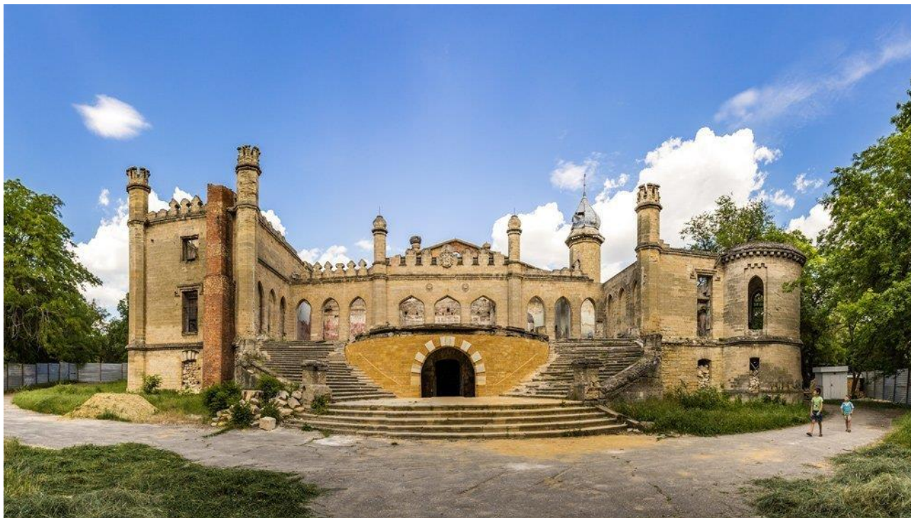
Фото 1.3.3 Замок Курисів, с. Петрівка Комінтернівського р-ну Одеської обл. [4]

спадщини Одеського регіону, яка має значний потенціал для розвитку культурного туризму, однак поки що не використовується як об'єкт показу, є замок Курисів у с. Петрівка Комінтернівського р-ну Одеської обл. (фото.1.3.3).