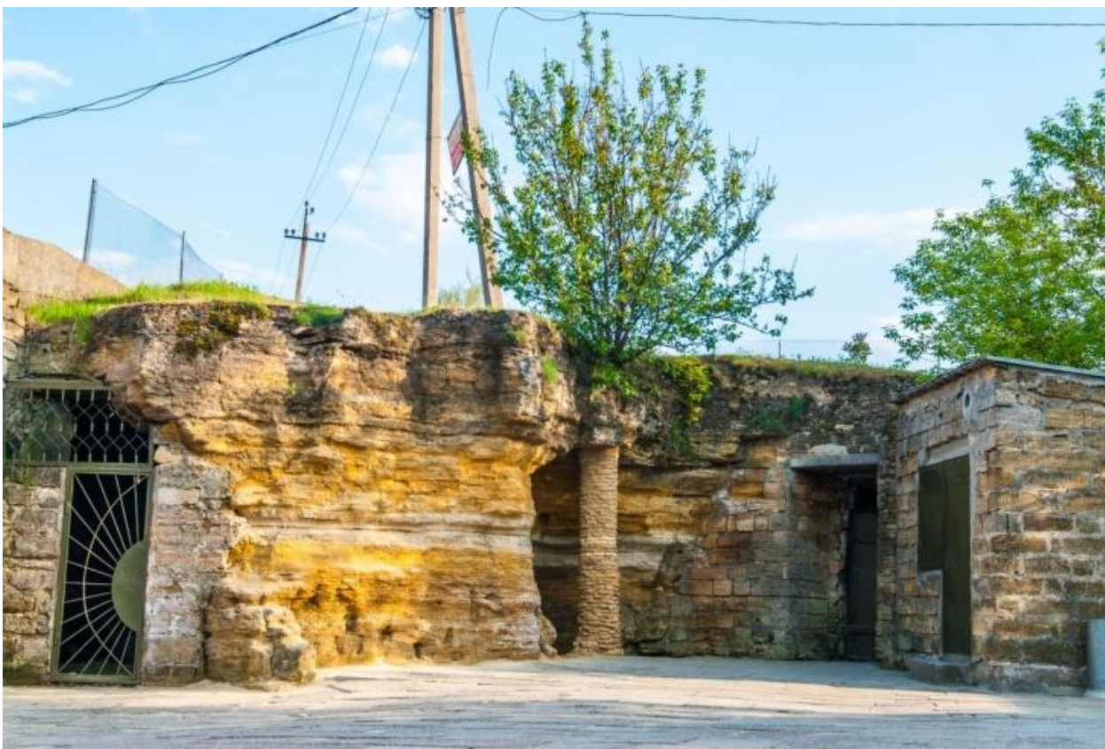
Фото 1.3.10 Музей «Нерубайські катакомби», с. Нерубайське Одеська обл. [4]

Неможливо не згадати музей «Нерубайські катакомби». Катакомбам, які простягаються під значною частиною населеного пункту і далі на інші райони. У підземеллях меморіального комплексу представлені предмети партизанського побуту й зразки зброї, на стінах наявні написи тих часів. Музей партизанської слави – єдиний офіційний вхід до просторих і багатокілометрових катакомб. У селі є інші входи до катакомб, але через те, що були часті випадки зникнення в катакомбах людей, ці входи засипали (фото 1.3.10).