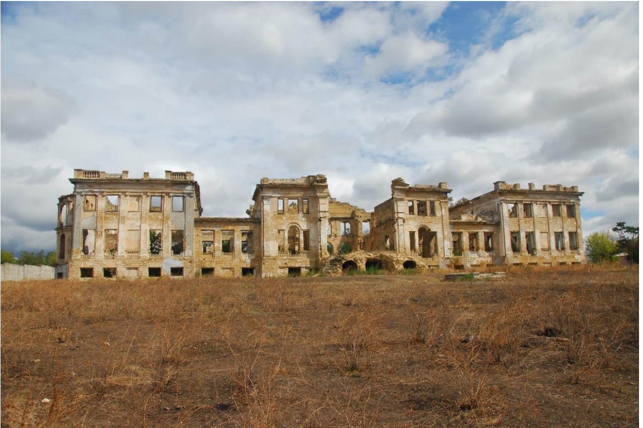
Фото. 1.3.2 Палац-садиба Дубецьких-Панкєєвих (с. Василівка Біляївського р-ну Одеської обл. [4]

Садиба належана родині Дубецьких, збудована генерал-майором В. Дубецьким. З 1917 р. по 1920 р. садибу займало відділення міліції. Після 1920 р. тут проживали місцеві жителі. Були розміщені адміністративні кабінети, клуб та кінотеатр. Після 1991 р. будівля почала руйнуватися. Місцеві жителі виймали віконні рами, двері, розбивали стіни на цеглу для власних будівель. Як наслідок обвалився дах, міжповерхові перекриття; на початку 2000-х обрушилася і головна західна стіна центрального корпусу. Зараз будівля може впасти повністю в будь-який момент. У 2007 р. садиба була продана за 1 млн. грн. ТОВ «Українська Кабельна Компанія» (м. Одеса) під зобов'язання історичної реконструкції до 2017 р. Однак, роботи по відновленню так і не були розпочаті.