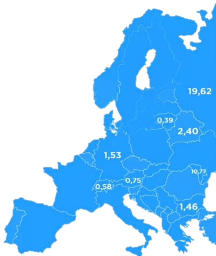
Рис. 2.1.2 Топ-10 країн, із яких їдуть до Одеси (%) [25]

Українці, які проводять відпочинок за кордоном, зазвичай обирають Єгипет, Польщу, Туреччину, Чорногорію і Грецію. При цьому не економлять на відпустці тільки 12 % співвітчизників. Більшість же намагається якимось чином мінімізувати витрати на відпочинок завдяки ранньому бронюванню та купівлі квитків, гарячими путівками. Також українці часто шукають безкоштовні пам'ятки (21 %), обирають малопопулярні недорогі напрямки (17 %) або намагаються не подорожувати в розпал сезону (15 %).