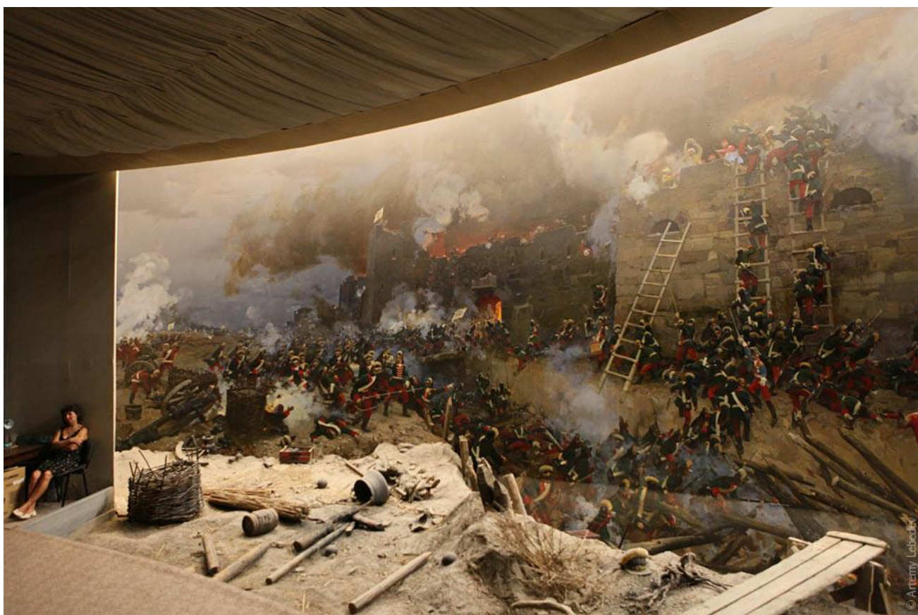
Фото 1.3.8 Діарама «Штурм фортеці Ізмаїл» [4]

На іншому кінці області є не менш відоме та популярне серед туристів місце музей – діарама «Штурм фортеці Ізмаїл» (фото 1.3.8). Це філія історико-краєзнавчого музею О. В. Суворова, яка була відкрита 9 травня 1973 р. в будівлі колишньої турецької мечеті XVI ст. До речі, мечеть – єдина споруда, що зберіглась від взятої суворовськими диво-богатирями фортеці. Робота над створенням діорами почалася в 1971 р. Вона була доручена відомій Студії ім. М. Б. Грекова, що створила близько 80 діорам. Художнє полотно розміром 20x8 м було успішно закінчено в 1973 р.