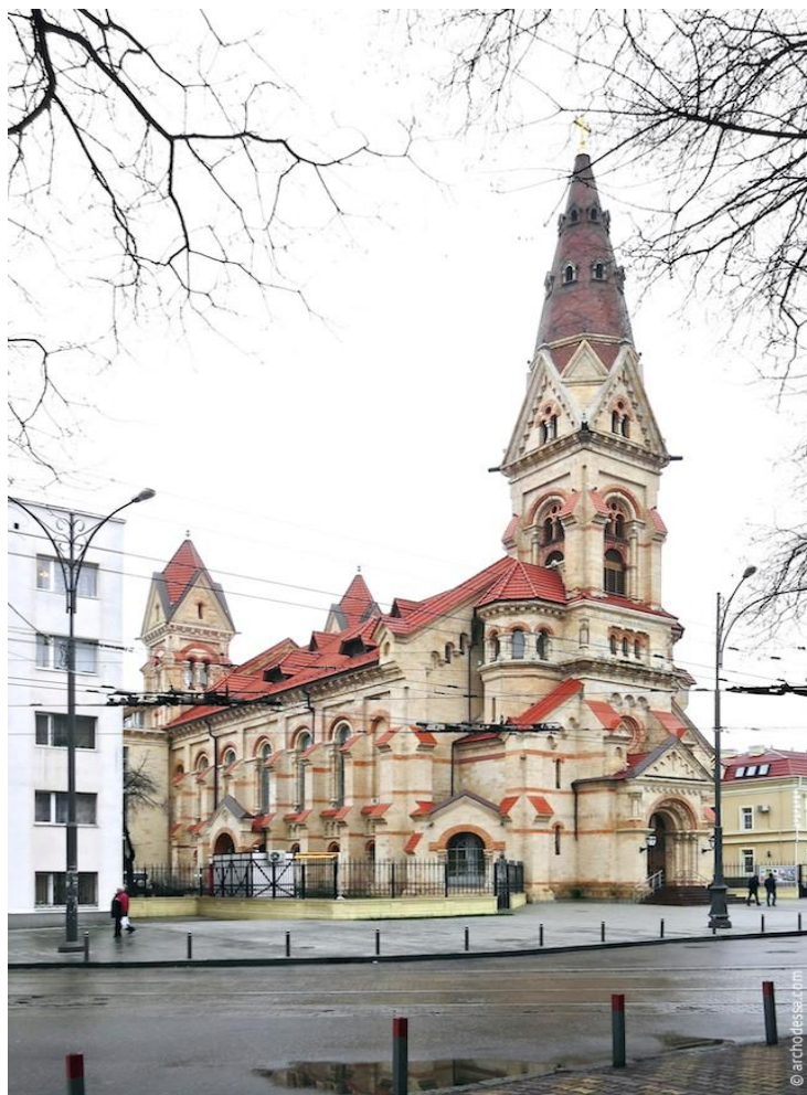
Фото 1.3.6 Центральний лютеранський кафедральний собор України Святого Павла, м. Одеса [4]

В м. Одесі існує успішний приклад відновлення історичної пам'ятки. Прикладом відродження з руїн є Кірха. На частку одного з найбільш важливих містобудівних об'єктів історичного центру Одеси – будівлі лютеранської церкви Святого Павла (фото 1.3.6).