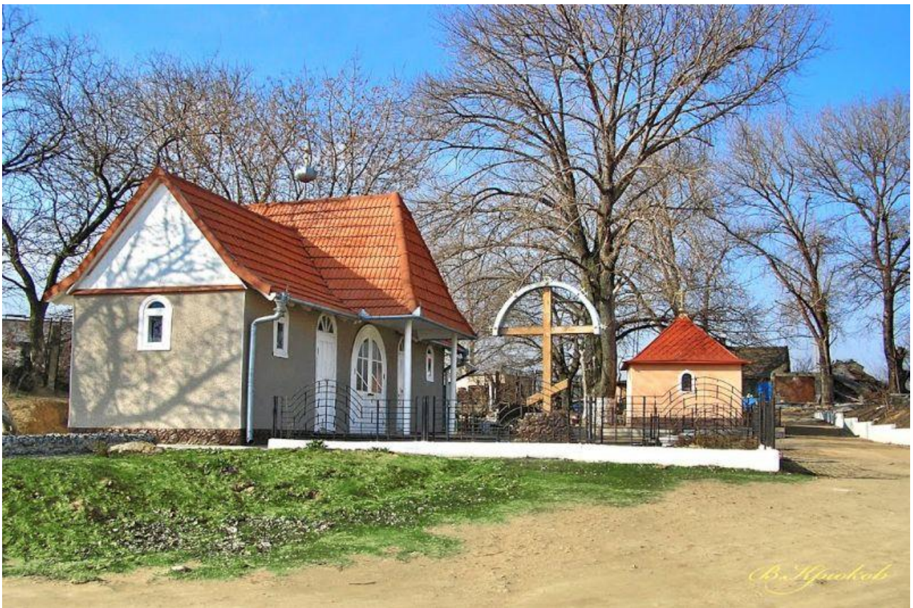
Фото 1.3.7 Церква Іоана Сочавського, м. Білгород-Дністровський Одеської обл. [4]

Неменш цінною для України пам'яткою архітектури, національного значення, можна вважати підземну церкву в Анкермані. Вона знаходиться у м. Білгород-Дністровський (фото 1.3.7).