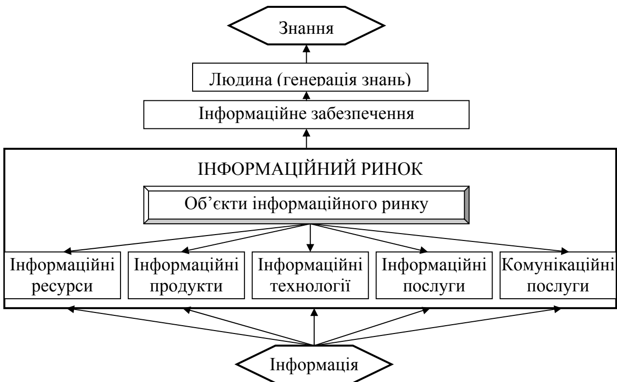
Рис. 2. Місце інформаційного ринку у ланцюгу інформація – знання

є визнання вирішальної ролі інформації для різних напрямів діяльності суспільства.